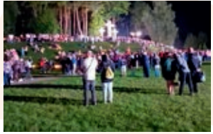
Aglona ist nicht nur ein Wallfahrtsort, es ist auch ein Ort des Gedenkens

Zu Mariä Himmelfahrt, am 15. August dieses Jahres, pilgerten etliche Kinder und Lehrkräfte aus der Christian-David-Schule bei Barkava in Lettland nach Aglona, einem wichtigen Wallfahrtsort in Lettgallen. Die Christian-David-Schule ist eine Schule der Herrnhuter. Die Jugendlichen hatten Zelte, Schlafsäcke, Töpfe, Essen und Gitarren dabei. Der Glaube ist lebendig in der jungen Generation in Lettland.