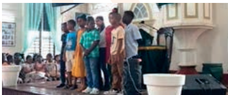
Die Kinder in der hölzernen Stadtkirche in Paramaribo

Im Jugendzentrum der Herrnhuter Brüdergemeine in Paramaribo, Suriname, fand ein Fest für alle Kinder der gemeindlichen Sonntagschulen im Rahmen des „Herrnhut Monats“ August statt. Das Thema lautete: „Ihr werdet meine Zeugen sein.“ Erinnert wird mit dem Fest an die Kindererweckung im alten Herrnhut am 17. August 1727.