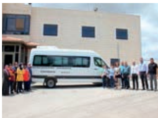
Die Mitarbeiterinnen und Mitarbeiter des Sternbergs