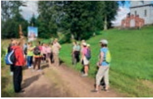
Die Schülerinnen und Schüler auf der Pilgerfahrt