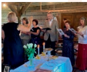
Im Betsaal von Pikavere

In diesem Jahr feierte die Herrnhuter Gemeinde in Pikavere in Estland ihren 195. Jahrestag ihres hölzernen Betsaals. Es fand ein Gottesdienst und Abendmahl statt, dazu sang der Herrnhuter Kirchenchor. Auch einige Freunde der Gemeinde aus Finnland nahmen an dem Festtag teil, die extra dafür anreisten.