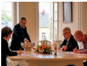
Das Ziehen der Losungen gehört zum zentralen Kern des kulturellen Erbes der Herrnhuter