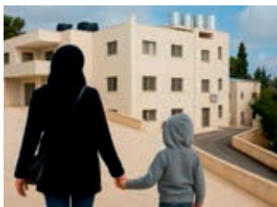
Mutter mit Kind auf dem Sternberg

Im Westjordanland gibt es bislang kaum geschützte Räume für Frauen und Kinder mit Behinderung, die Gewalt erlebt haben. Die bestehenden staatlichen Schutzhäuser sind für ihre besonderen Bedürfnisse nicht ausgelegt – oft werden sie dort gar nicht aufgenommen.