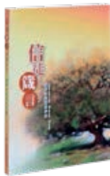
Losung auf Mandarin