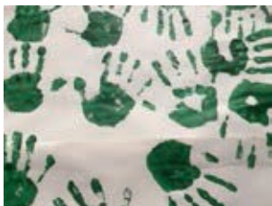
Von den Kindern auf der Rüstzeit