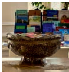
Die historische Losungsschale wird in der Ausstellung ebenfalls gezeigt

Letztes Jahr wurde Herrnhut als Teil der Siedlungen der Herrnhuter Brüdergemeine zum UNESCO-Welterbe ernannt. Im Zuge von Umbauarbeiten im Kirchensaal wurde die Ausstellung, die es seit etwa 16 Jahren gibt, Ende letzten Jahres abgebaut.