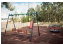
Spielgeräte auf dem Sternberg

Ein Beispiel: Ein junges Mädchen mit geistiger Behinderung, das Opfer sexualisierter Gewalt wurde, konnte in keinem Schutzhause untergebracht werden. Es fehlte an geeigneten Unterbringungsmöglichkeiten, an Personal und dem gesellschaftlichen Willen, Inklusion umzusetzen.