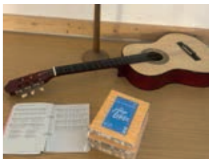
Die Jugendlosungen sind immer dabei

Wir dürfen uns freuen, dass seit vielen Jahrzehnten Kinder aus ganz verschiedenen Teilen Deutschlands zur Kinderrüstzeit in das Rüstzeitenheim Sonnenschein in der Gemeinde Ebersdorf kommen. Ein biblisches Thema bildet dafür immer die Grundlage.