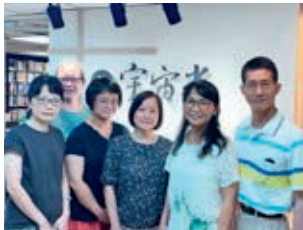
Zusammen mit Mitarbeiterinnen des herausgebenden Verlages

Die Losungen für die Volksrepublik China und Taiwan werden bereits seit den 1930er herausgegeben – allerdings mit Unterbrechungen. In den Jahren von 2005 bis 2010 konnte die taiwanische Ausgabe zum Beispiel nicht herausgegeben werden, da niemand mehr da war, um die Losungen ins Chinesische zu übersetzen.