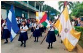
Die Schüler der Herrnhuter High-School

Die Straßen im Zentrum von Bluefields, Nikaragua, färbten sich am frühen Samstagabend, dem 23. August, blau und weiß, die Nationalfarben Nikaraguas. Die Schülerinnen und Schüler präsentierten sich in ihren Schuluniformen – darunter auch die Schülerinnen und Schüler der